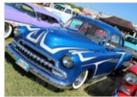
Il pubblico si è rifatto gli occhi con vetture americane di indiscusso fascino

Novità per l'edizione 2014 è stata poi la gara di Soap Boax, iniziativa di Kustom Weekend Organization. 8 team tra cui Lake Cruiser, Bubble Team, Foam, Duro Siluro, Wise Guys, Slackers, Team Gatti e Crazy Cruiser CH, si sono sfidati in lanci liberi da apposita pedana, alla guida di piccole vetture autocostruite, senza motore. Una tradizione che arriva da lontano, dagli anni '30 circa in Ohio, USA.