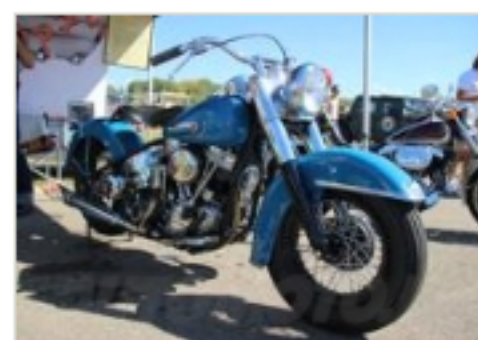
Harley-Davidson, le grandi protagoniste della Hills Race

Regina del week-end di Rivanazzano Terme è stata la gara d'accelerazione disputata lungo i 402,33 metri di rettilineo o quarto di miglio. La griglia di partenza ha registrato 94 iscritti con una forte predominanza di driver italiani: ben 42 i piloti nostrani anche se i francesi con 31 presenze non hanno perso l'occasione per farsi notare. Anche altre nazioni hanno avuto il loro portabandiera a conferma del sapore internazionale di Hills Race: 14 partecipanti dalla Svizzera, 2 dall'Austria, 4 dalla Germania e 1 delegato persino dal Portogallo.